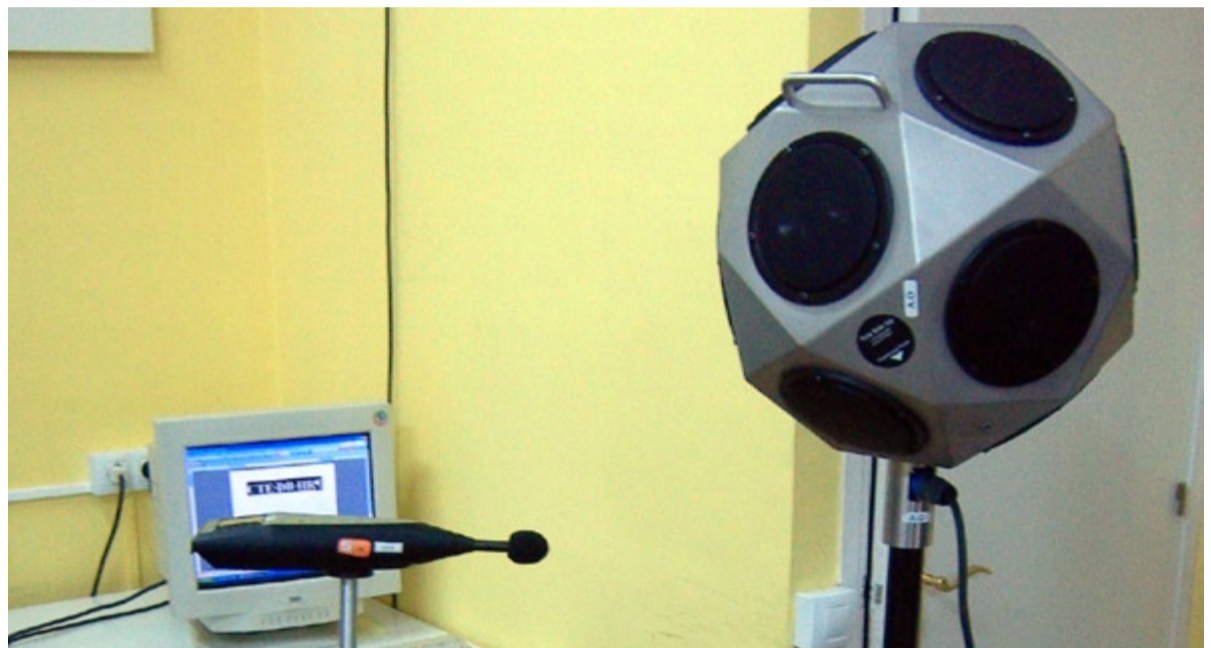
FIGURA 1. MESURA D'AÏLLAMENT IN SITU

El següent gràfic mostra el valor del FG en funció de la profunditat